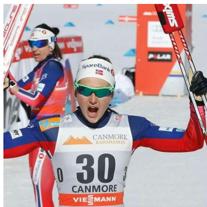
Ingvild Flugstad Østberg

WC 2015-16: Nr. 2 sammenlagt Tour de Ski 2016: nr. 2 sammenlagt 21 pallplasseringer i WC 2015-16